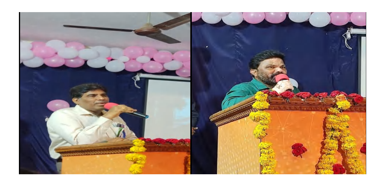
Chiefs Addressing the Students