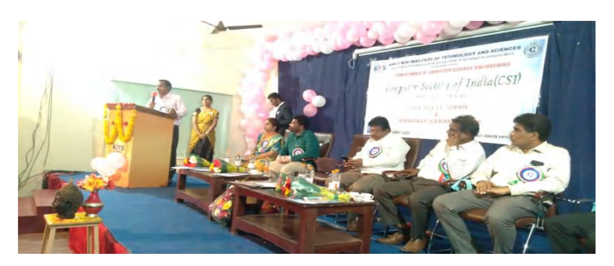
Guest Lecture on "Big Data "Big Data Analytics"