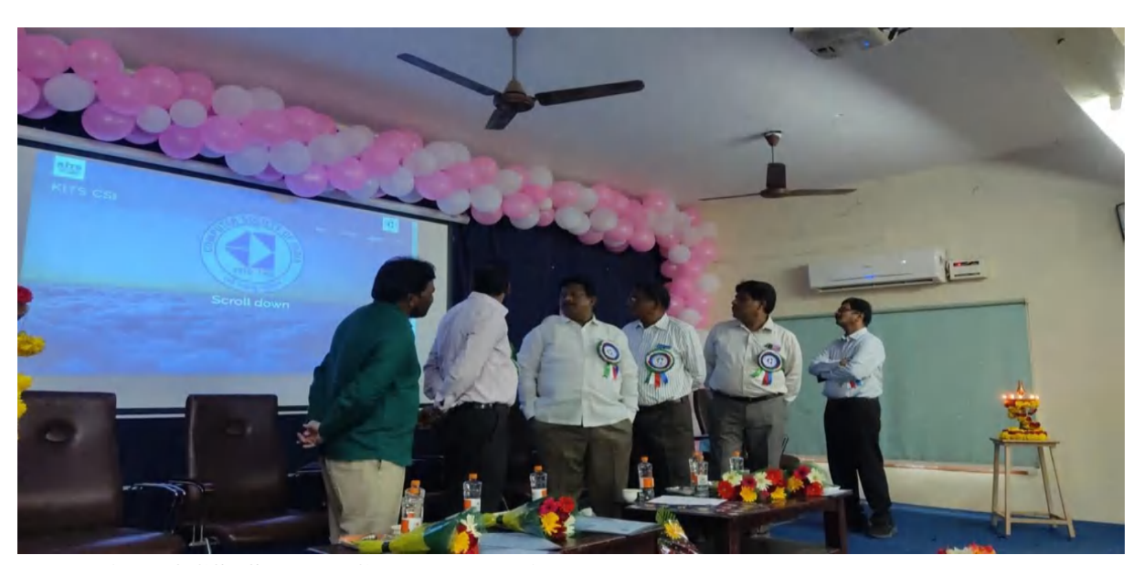
Launching of CSI Student Chapter Website